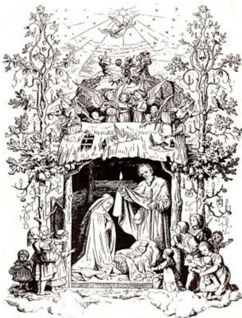
De natuur viert de geboorte van het kind 19 e -eeuwse Duitse pentekening